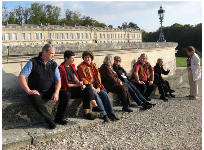
Erschöpfte aber glückliche Touristen in Chantilly