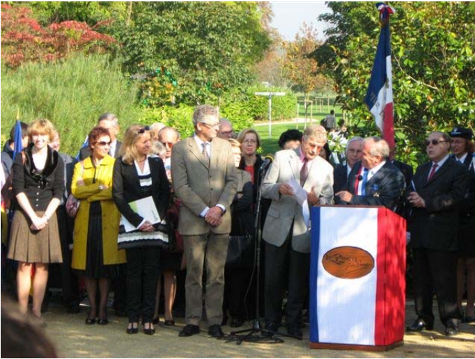
Feierliche Einweihung der "Esplanade de l'Europe"